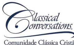
Comunidade Clássica Cristã CCBrasil - Classical Conversations Brasil