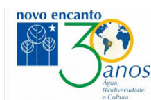
Associação Novo Encanto