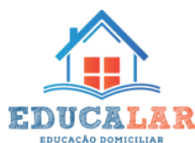
Educalar - Educação Domiciliar