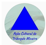
Ação Cultural do Triângulo Mineiro - ACTM