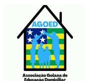
Associação Goiana de Educação Domiciliar - AGOED