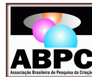
ABPC - Associação Brasileira de Pesquisa da Criação