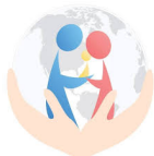
Associação de Famílias de Cascavel e Região - AFCR