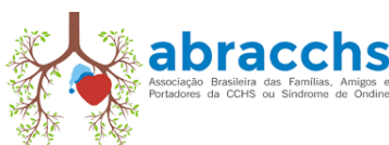
Associação Brasileira das Famílias, Amigos e Portadores da CCHS ou Síndrome de Ondine - AbraCCHS